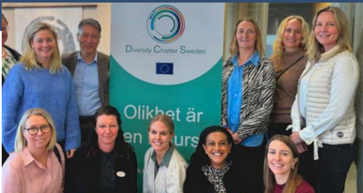
Första medlemslunchen i Jönköping.