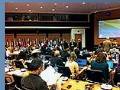
EU-mötet Equality Summit - Promoting Equality for Growth, i Nicosia samlade beslutsfattare från hela Europa.