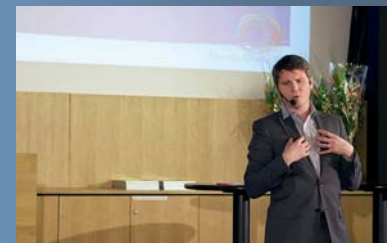
Integrationsminister Erik Ullenhag på Signatory Event hos Folksam.

KTH - Möte med ROBYT KTHs erfarenheter av mångfaldsarbete samt Mångfaldsspelet Mr. Norm