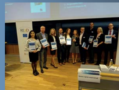
De nya medlemmarna får sina diplom på Signatory Event på KTH.