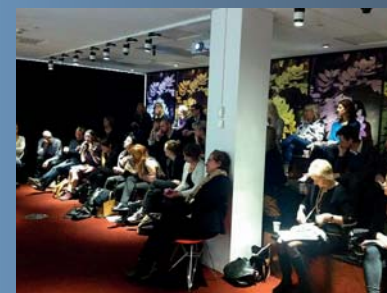
Många intresserade medlemmar på Fredagskunskap om mångfald.